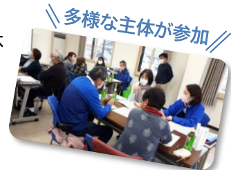
多様な主体が参加

既にある支え合い活動など地域の情報を共有したり、高齢者の生活を支援する体制の充実や社会参加の推進を 住民主体 で図っていく取り組みをすすめるために、支え合い・助け合い活動について考え、話し合いを行っています。