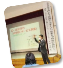
これまでの取り組み